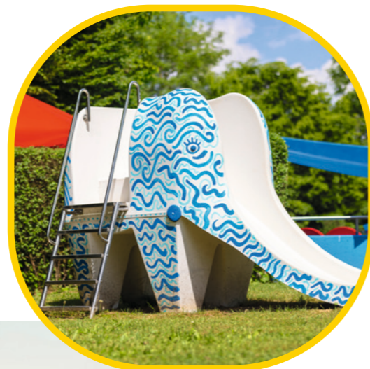
Der neue Spielplatz erstrahlt im Freibad Unterrombach.