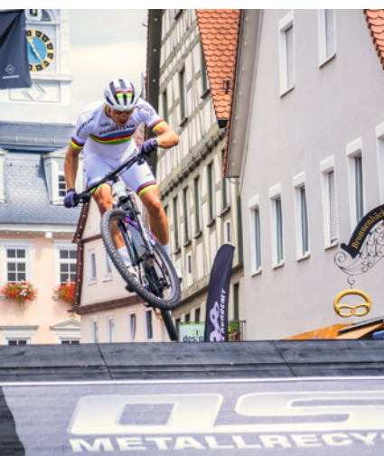
Rasante Radfahrer*innen beim Mountainbike-Sprint-Weltcup.

Viele Veranstaltungen wären ohne die Hilfe von Sponsoren nicht möglich. Den Stadtwerken Aalen ist es ein zentrales Anliegen, die Kultur-, Konzert- und Sportlandschaft in Aalen zu unterstützen und zu einem lebendigen Aalen beizutragen.