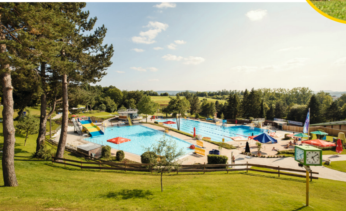
Ab Mai geht es los: Die Freibäder sind für die Badegäste bereit.