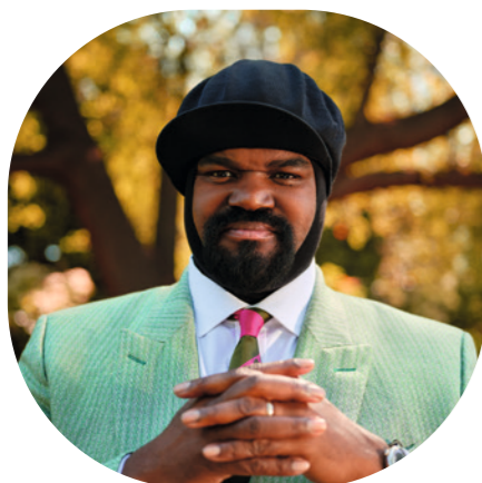
Gregory Porter überzeugte schon zwei Mal mit seiner kraftvollen und auch sanften Stimme beim Aalener Jazzfest.

Mehr Infos zu den Konzerten und Karten unter: www.aalener-jazzfest.de