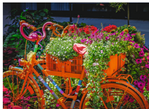
Ein Publikumsmagnet in der Aalener Innenstadt ist die Aktion „Aalen City blüht“.